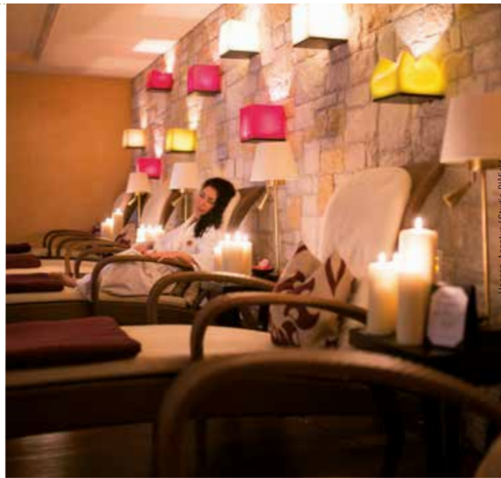
Hessen-Agentur / Studio Bläfeld

Verschiedene Saunen (Finnische Sauna, Sanarium), Hamam, Dampfbad, Tauchbecken mit Duschtempel, Solebecken, Tepidarium, Ruheräume, Freibereich und Kräuterbad.